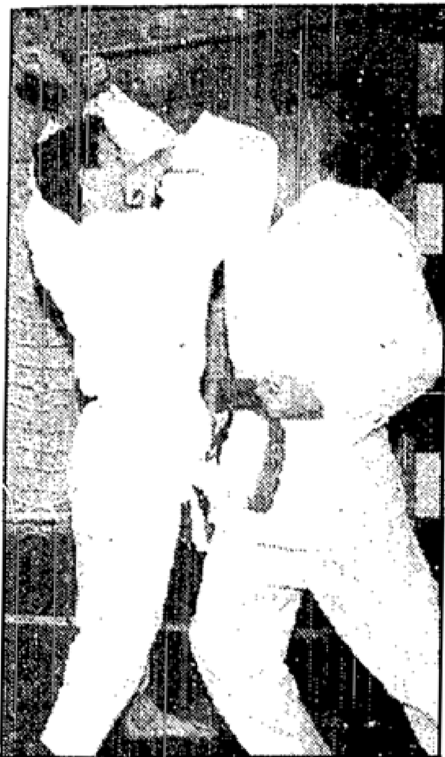
Eine neue Technik wird gezeigt. Kraft paart sich mit Gewandheit.