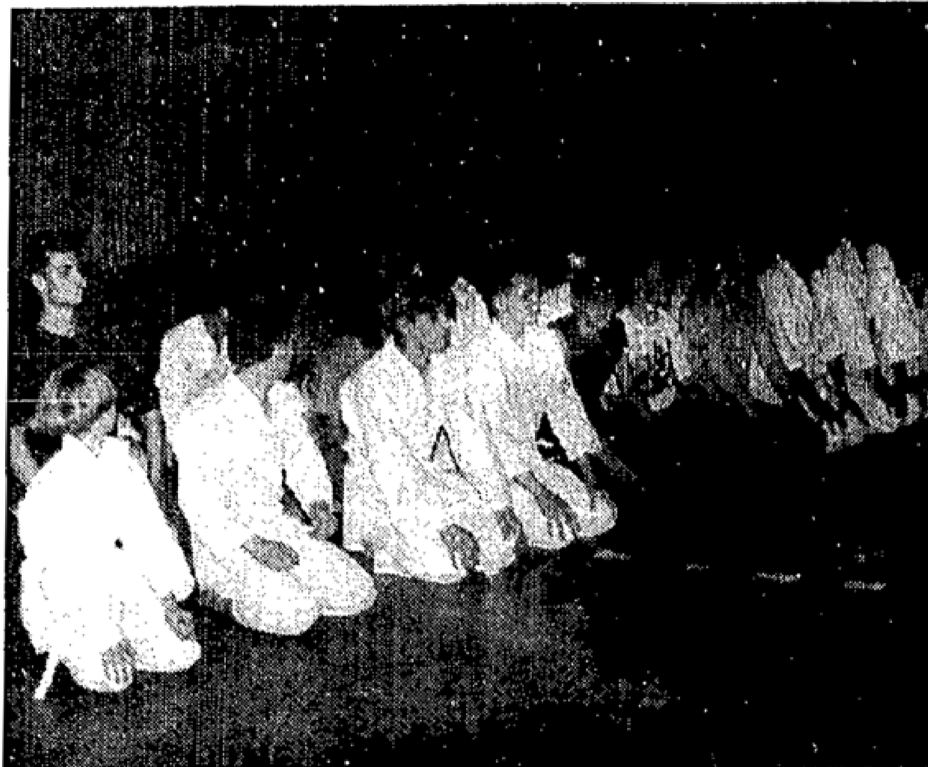
Mitglieder der Beeskower Karate Do-Gruppe kurz vor Beginn der Trainingsstunde, in der es dann sehr diszipliniert zugeht.