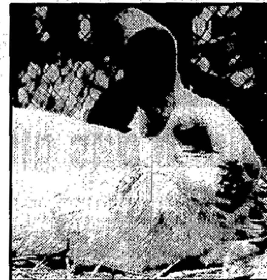
Auch der „Helle Großsilber“ bekam in der Bewertung viele Punkte.