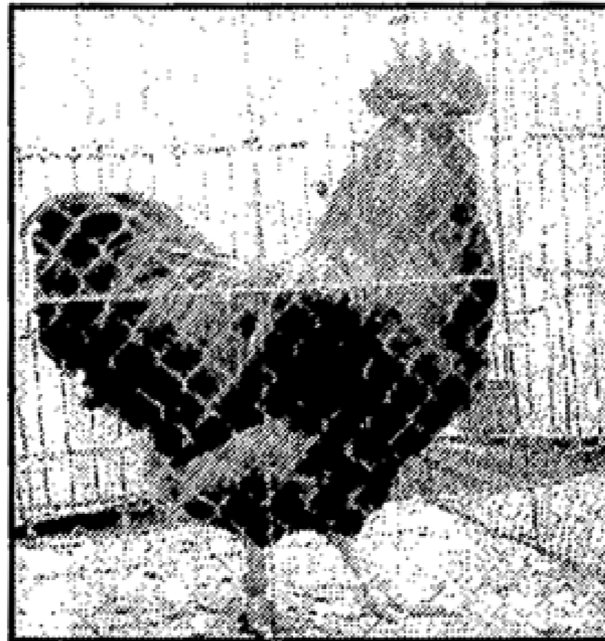
Ein stolzer Bursche der Rasse New Hampshire, der sich da präsentierte