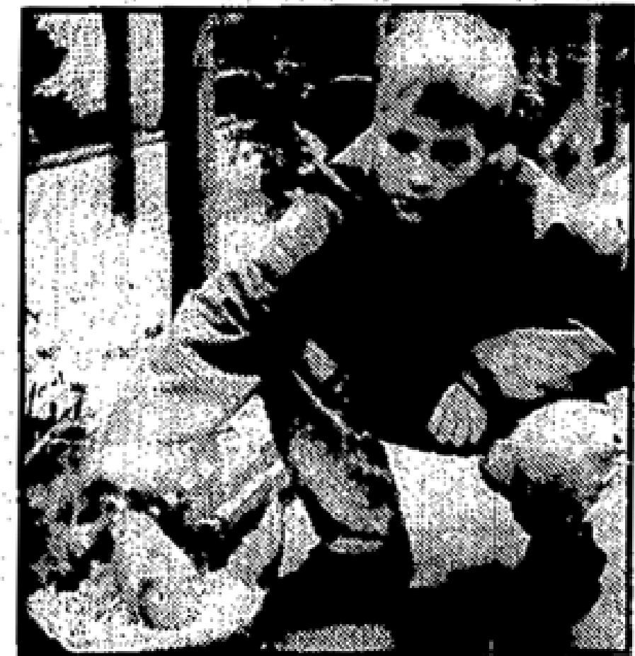
Für die jüngsten Besucher gab es auch Streicheltiere zum Anfassen.