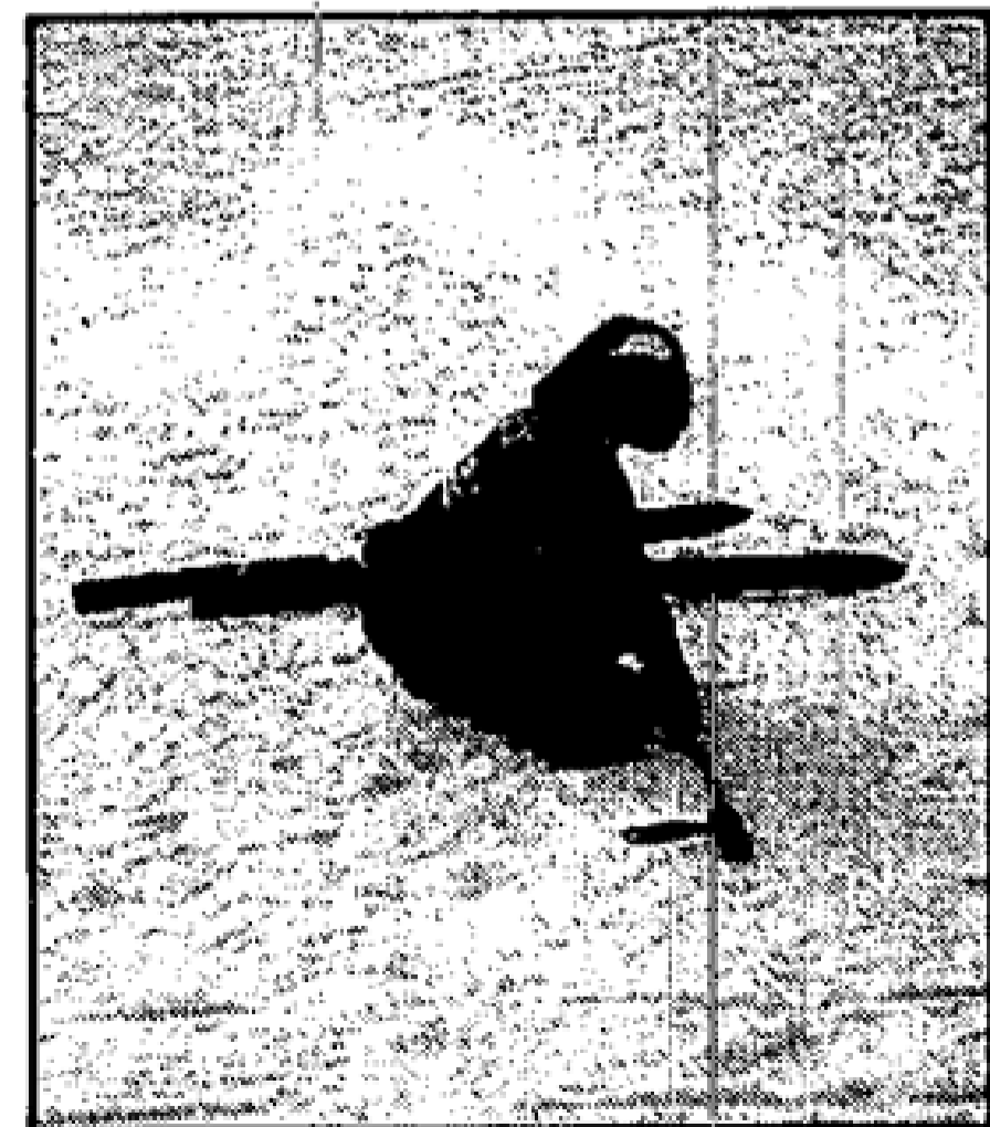
Eine Landung im Schnee nahm Nadine Groschke gelassen hin.