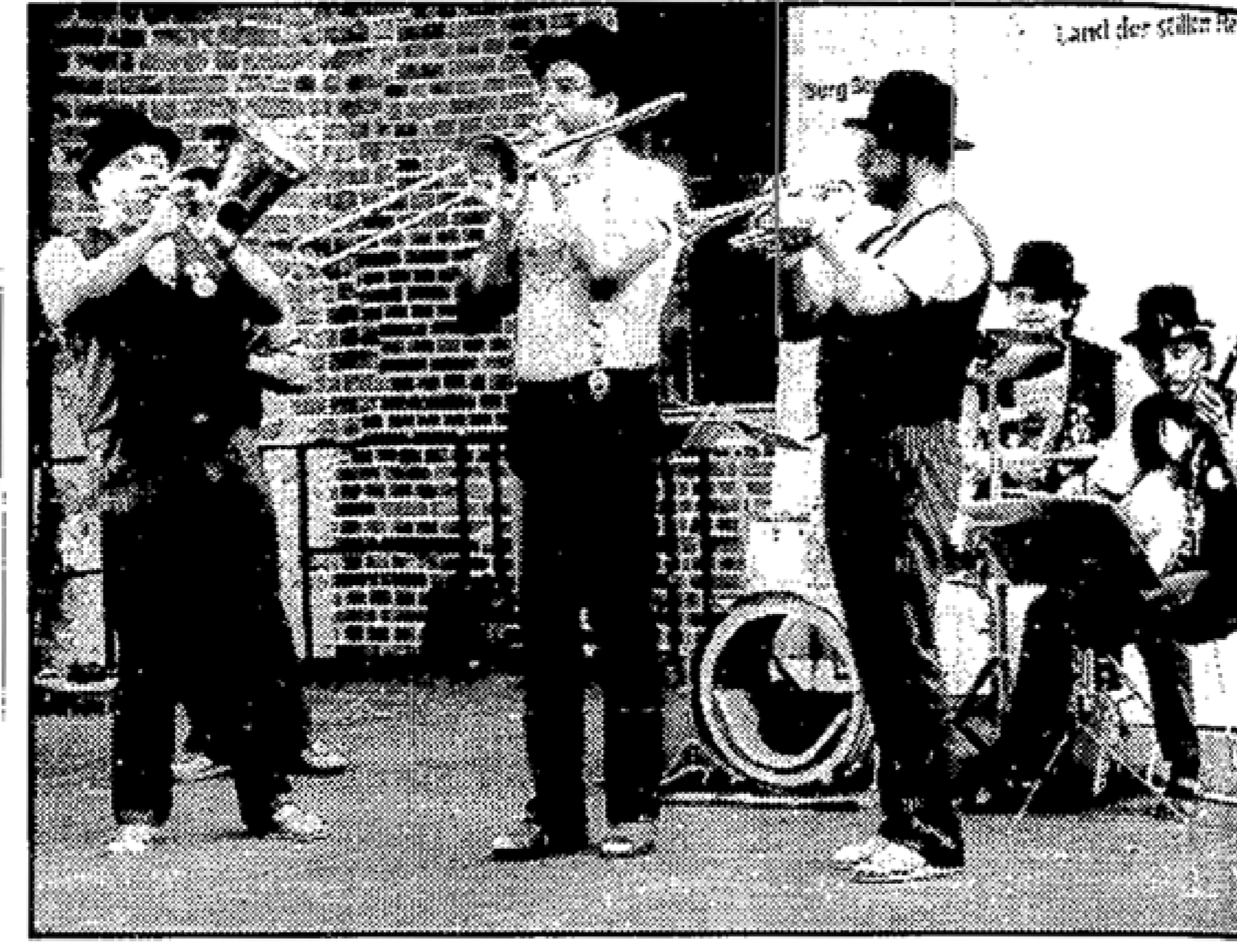
1. Dixieland-Festival Beeskow '93: Auf dem Bertholdplatz spielen zunächst die Steve Horn Band, Steinhäuser Quartett, Charles Bridge DIXIEBAND. Auf der Burg kommen die Kreuzberg Stompers dazu. Zum Frühshoppen am Sonntag spielen die SASPOWER DIXESTOMPERS, Steinhäuser Quartett und HANS PROCELLS SESSION BAND.

Beeskow (MOZ) Zuerst ganz groß geplant, dann wegen Geldsorgen, die es nicht nur im Kreis Beeskow und der Kreisstadt, sondern auch beim großen Partner Krefeld gibt, auf ein Minimum geschrumpft, steht uns nun doch ein umfangreiches Partnerschaftswochenende ins Haus. Ein Höhepunkt wird zweifellos die Burgparty mit dem 1. Beeskower Dixielandfestival. Im Rahmen der Veranstaltung, die am Sonnabend um 20.00 Uhr beginnt, soll dann auch das Kulturabkommen zwischen Beeskow und Krefeld ausge-