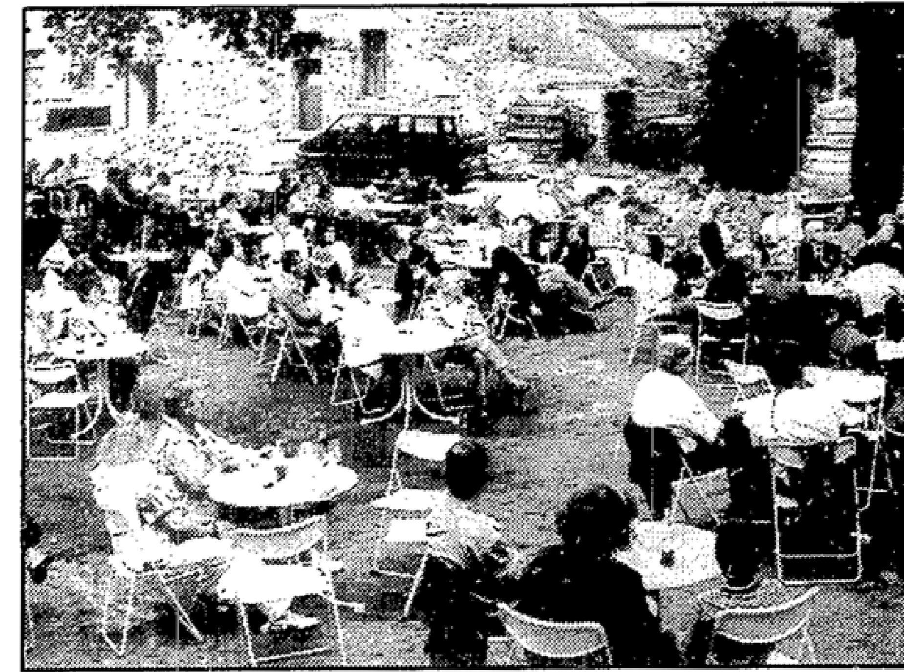
Strahlender Sonnenschein und schon wird der Burghof voll. Hoffentlich auch an diesem Wochenende. Die Meteorologen haben jedenfalls gutes Wetter vorausgesagt. Und außerdem bleibt für den Notfall immer noch das gute alte Burggemäuer, das auch eine ganze Menge Besucher aufnehmen kann.

Ach ja, das Wichtigste fehlt ja noch. Bei der Burgparty am Sonnabend wird eine Absichtserklärung zur kulturellen Zusammenarbeit zwischen Beeskow und Krefeld ausgetauscht. Ich denke, auch ein Zeichen, daß unsere Partnerschaft noch sehr lebendig ist. Euer Dicker